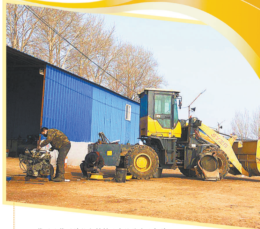
肇州县肇州镇壮家村村民在检修农业机械。

近几年，肇州县还改造了“四类重点对象”危房3697户，全县农村砖瓦化率达到了85%；新建、改造饮水安全工程130处，受益人口22.92万；落实健康扶贫政策，贫困人口参加基本医疗保险率、家庭医生签约率均达到100%，减轻了贫困人口医疗负担；落实教育扶贫政策，减免贫困学生多项费用，确保贫困家庭适龄儿童、少年不失学辍学。同时，他们还开展农村人居环境综合整治，实现了路平、地净、灯亮、水清、树绿、景美，贫困群众获得感和幸福感大幅提升。