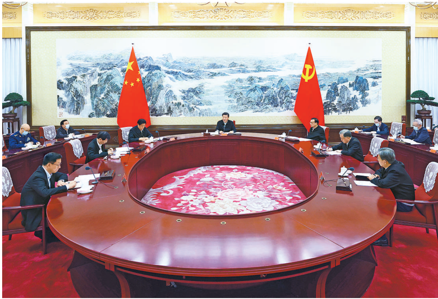
12月24日至25日,中共中央政治局召开民主生活会,中共中央总书记习近平主持会议并发表重要讲话。