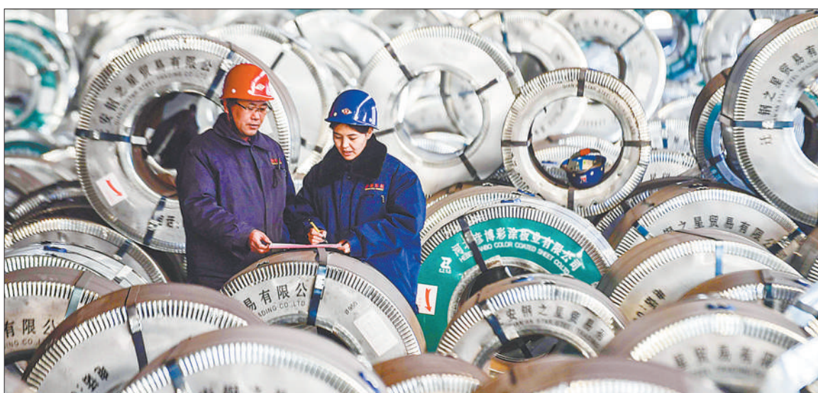
▲12月9日,位于河北省迁安市高新技术产业开发区的河北彦博彩涂板业有限公司,员工在核准出口到乌克兰的产品订单。今年以来,迁安市累计完成进出口总额163.8亿元,同比增长41.3%。