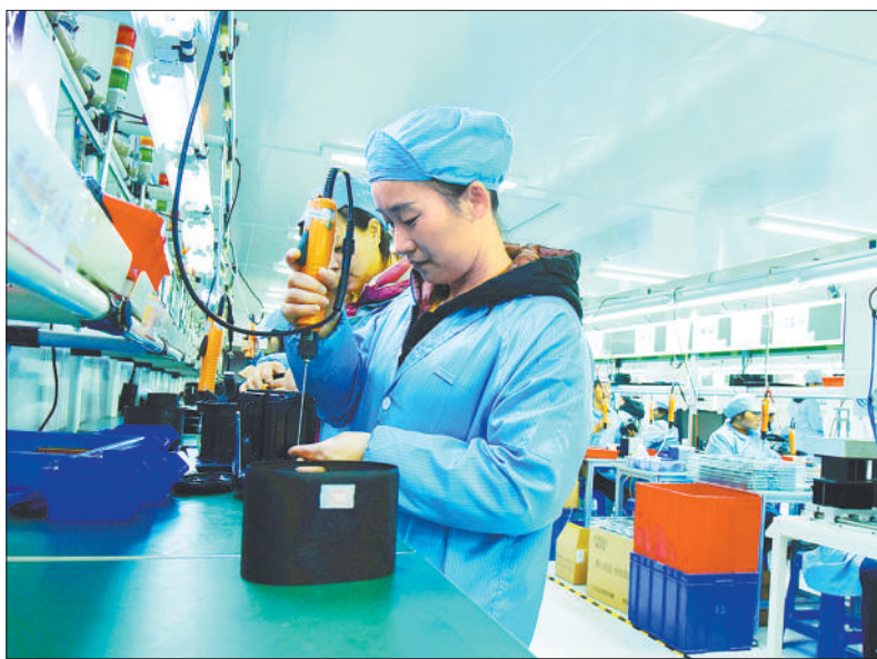
▲12月9日,位于江苏省海安市立发街道的江苏联发纺织股份有限公司,员工在加工出口的纺织品。当地纺织企业瞄准市场需求,加大产品研发力度,开发的新产品出口东南亚、欧美等国家和地区。