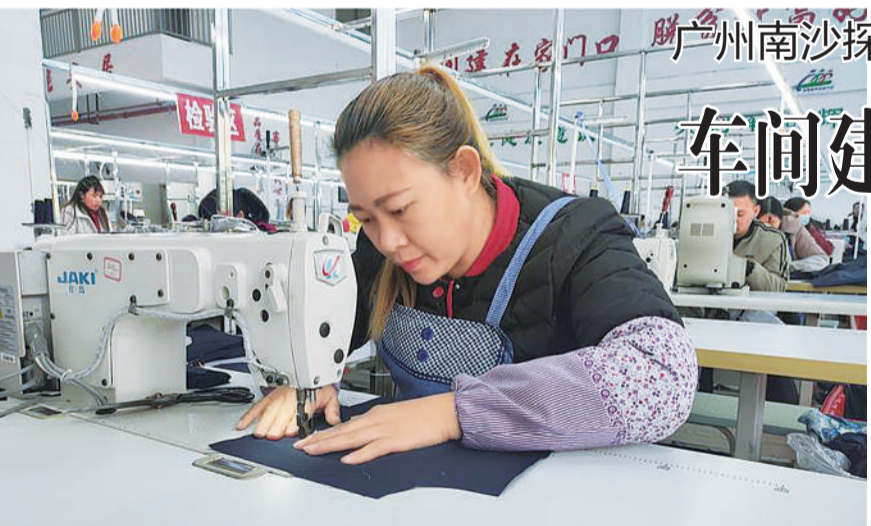
贵州黔南州惠水县伊科达制衣厂的扶贫车间里，工人在生产服装。

“这里一年四季都种蔬菜，我们一年都有工作可以做。打零工，一天工资70元，长期干，每个月就有3000元。”在贵州省黔南布依族苗族自治州龙里县湾滩河镇蔬菜大棚里，工人石传珍向记者介绍，现在在基地种菜，离家只要十几分钟，收入也翻了几番。近年来，广州市南沙区在开展东西部扶贫协作过程中，整合粤港澳大湾区优势资源，多方开展扶贫项目，激活当地脱贫造血功能。