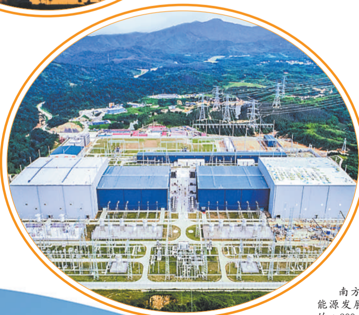
南方电网广东电网能源发展有限公司承建的±800千伏龙门换流站的建设现场

11月20日,南方电网广东电网能源发展有限公司,引入战略投资者增资扩股协议签约仪式在广州举行。这是国内率先完成股权多元化改革的国企“双百行动”电网系统电建类企业。