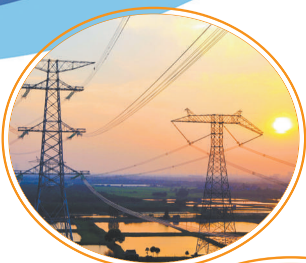
南方电网广东电网能源发展有限公司承建的世界交流电压等级较高的工程——1000千伏淮南—南京—上海线路工程