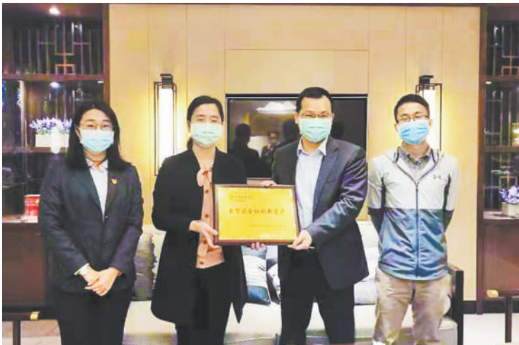
广东农行FT账户助力天禾农资疫情期间复工复产。图为广东农行为天禾农资颁发“自贸区金融创新客户”牌匾。

快、业务规模大、产品种类多。全球超1500家境内外企业选择广东农行FT账户,其中行业龙头、世界500强企业超百家。同时,陆续推出国际结算、衍生品交易、贸易融资、并购贷款、银团贷款、FT全功能资金池等多项业务,创新产品百花齐放。