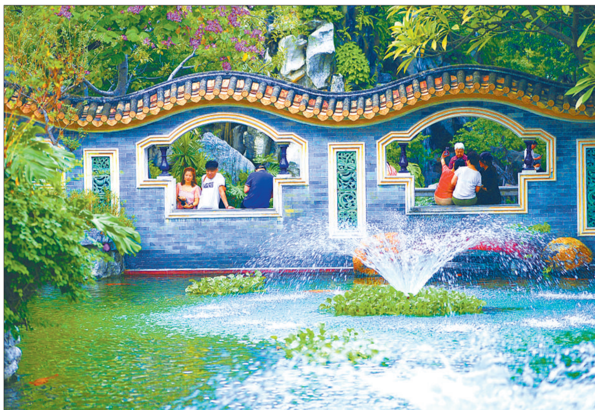
▲佛山市顺德区清晖园景区，游客在此感受岭南园林风情。近年来，顺德区全面整合提升文化、商业、旅游资源，积极推动旅游小镇建设，吸引八方来客。