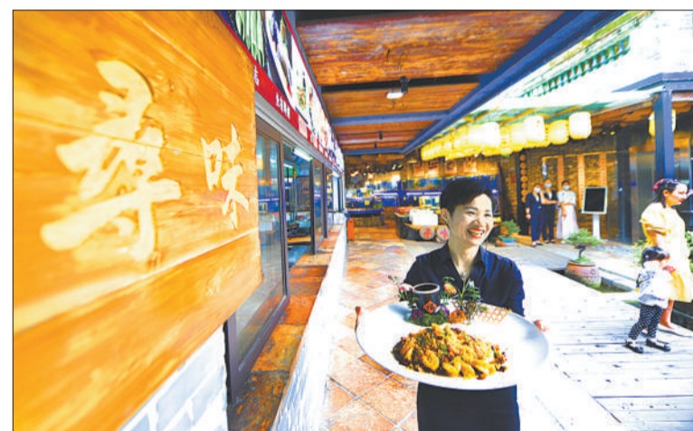
本版主编 李景录 编辑 高兴贵