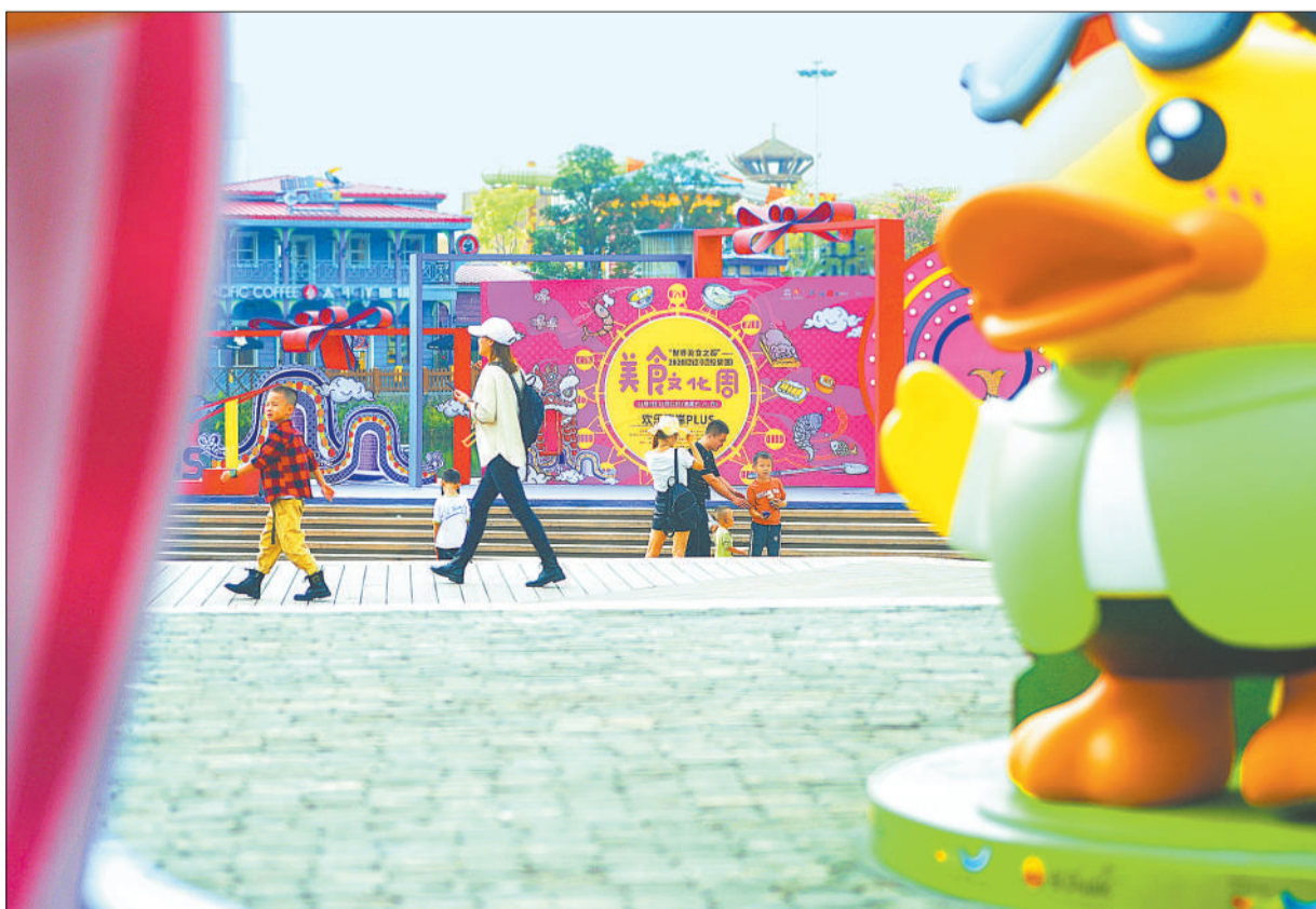
▲佛山市顺德区以美食为媒，带动文旅市场及相关产业快速发展。