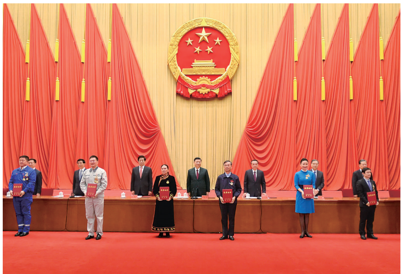
11月24日,全国劳动模范和先进工作者表彰大会在北京人民大会堂隆重举行。这是习近平等党和国家领导人向全国劳动模范和先进工作者代表颁发荣誉证书。

新华社北京11月24日电 全国劳动模范和先进工作者表彰大会24日上午在北京人民大会堂隆重举行。中共中央总书记、国家主席、中央军委主席习近平出席大会并发表重要讲话,代表党中央、国务院,向受到表彰的全国劳动模范和先进工作者表示热烈的祝贺,向为改革开放和社会主义现代化建设作出突出贡献的我国工人阶级和广大劳动群众致以诚挚的问候。