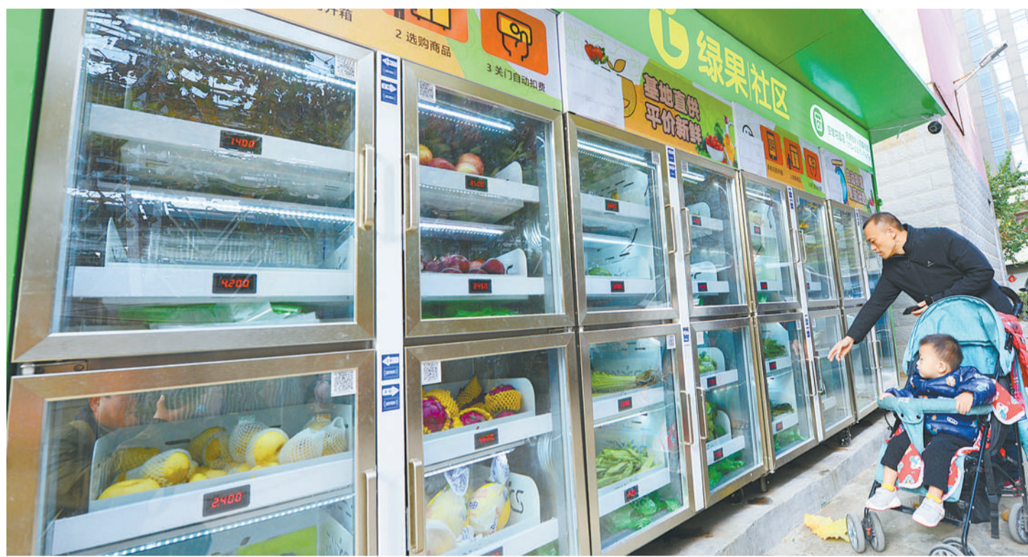
11月19日,河南省郑州市郑东新区空管花园小区,居民在无人智能生鲜柜前选购蔬菜。

受新冠肺炎疫情影响,零售行业面临着到店客流量下降、购买频次下降等困难。为了渡过难关,零售业更加注重创新,企业也积极求变。目前,无接触购物、直播带货、社区团购等新渠道、新服务不断涌现,线上线下融合速度进一步加快,消费市场正在发生翻天覆地的变化。专家指出,对中国零售企业来说,搭上这一轮变革快车,才能真正赢得未来。