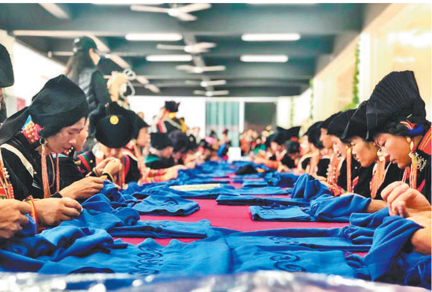
四川美姑县牛牛坝乡易地扶贫搬迁集中安置点第一刺绣艺术工作坊内，绣娘们在认真制作彝绣产品。

荞麦、玉米、土豆，如果依然种植这种传统品种，洛俄依甘乡阿卓瓦乌村村民每亩地一年仅收入700元左右。“种葡萄效益更好。”村民古次呷铁头脑灵活、手脚勤快。2018年3月，他从翻地、学技术、选种一步步学起，如今家里的3亩葡萄已经挂果。“克伦生葡萄的特点就是水分足、甜度高、口感好，为了保留葡萄的生态价值，我们不打农药，照顾得可仔细了。”古次呷铁曾专程到西昌学习种植技术，他预估今年葡萄亩产能达到4000斤。“以前3亩地一年到头能挣2000多元算不错了，今年有希望挣到10万元。”古次呷铁信心十足地说。