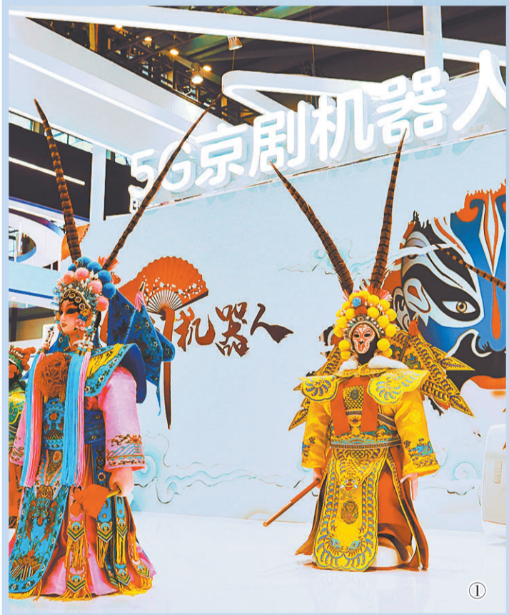
图① 在第二十二届高交会上，中兴5G京剧机器人正在准备表演。

近年来，神州云海不断开拓智能化应用，已累计申请专利180余项，并已在服务机器人精准识别和智能交互等高端人工智能技术方面抢占先机。