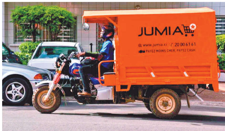
图为非洲电子商务平台JUMIA的配送员正在配送商品。