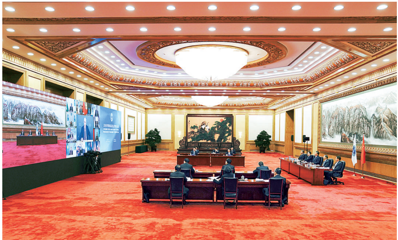
11月10日晚,国家主席习近平在北京以视频方式出席上海合作组织成员国元首理事会第二十次会议并发表重要讲话。