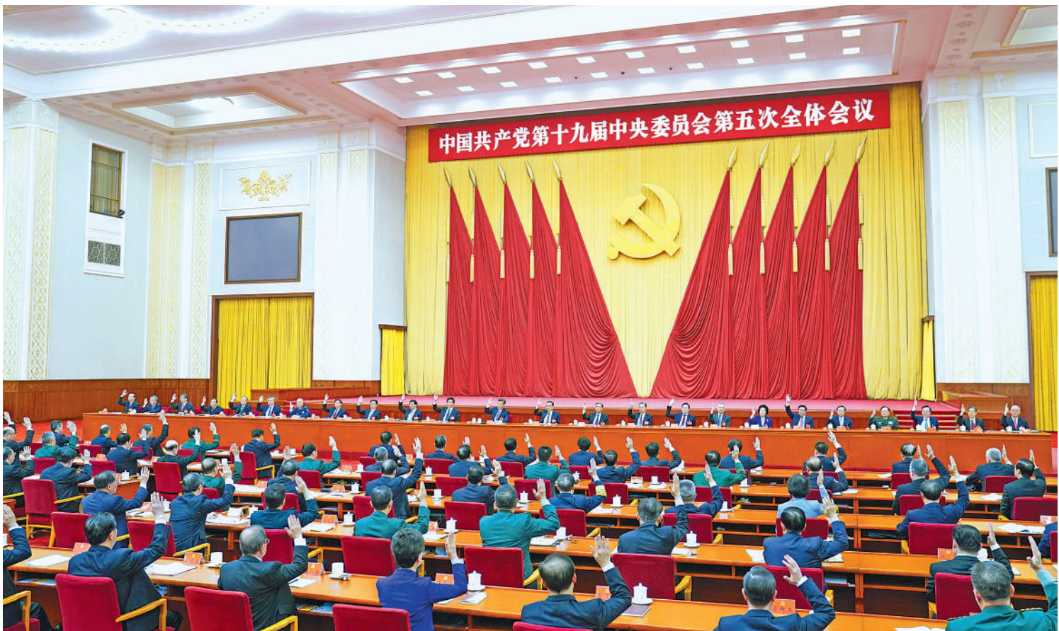
中国共产党第十九届中央委员会第五次全体会议,于2020年10月26日至29日在北京举行。中央政治局主持会议。