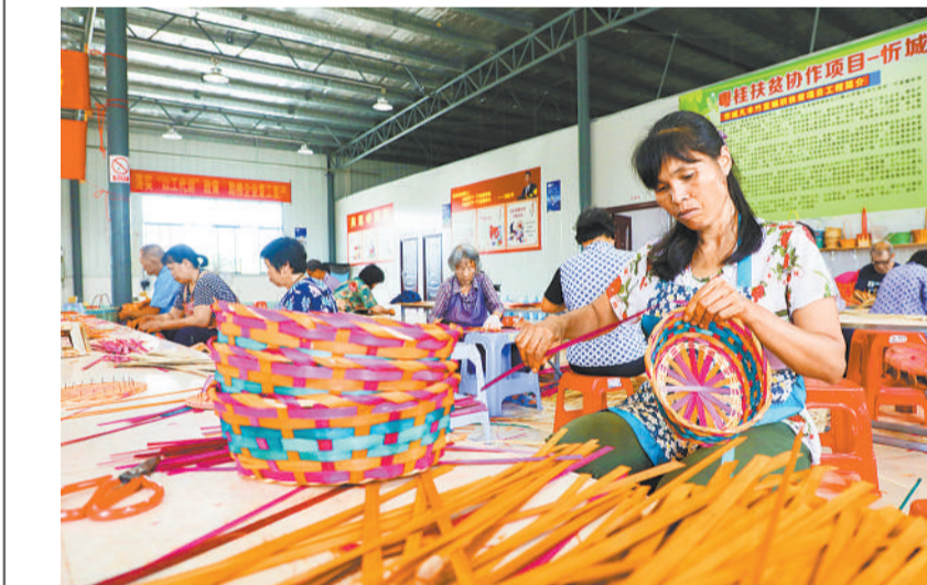
贫困户在广西来宾市忻城县凡丰竹篮扶贫车间编织竹篮。

从资金、技术、人才、产业等方面，茂名市发挥优势，做到了“来宾所需，茂名所能”，全力支持来宾市脱贫攻坚。血液于水的深情厚谊，在倾囊相助、雪中送炭的帮扶中书写了很多粤桂扶贫协作的动人故事。