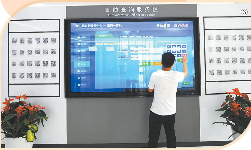
图③ 2020年8月20日，市民在河北省廊坊市大厂回族自治县24小时自助政务服务厅查询业务办理进度。