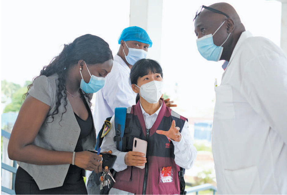
8月29日,在几内亚首都科纳克里的中几友好医院,中国抗疫医疗专家组成员(中)为当地防疫工作提出建议。