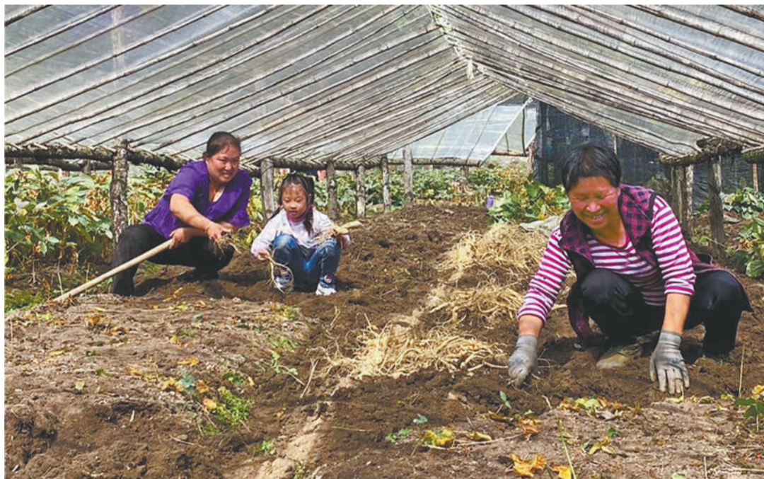
陕西省汉中市留坝县留侯镇河口石村村民正在采收西洋参。

留坝县先后提出“药菌兴县”战略和“四养一林一旅游”产业发展格局，确定由县级领导分管，落实