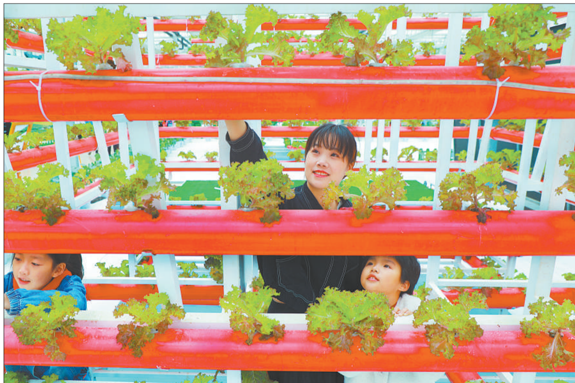
▼10月5日，湖南省永州市仁山湖美田园综合体，游客在了解现代农业知识。国庆假日，当地乡村旅游市场火爆，全市乡村旅游接待人数同比增长30%左右。