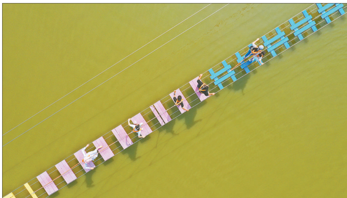
▲10月2日，浙江省德清县钟管镇曲溪曲尺湾营地，游客在体验七彩漂移桥。国庆中秋假日，德清县钟管镇吸引了来自北京、上海等地游客前来体验乡村旅游。