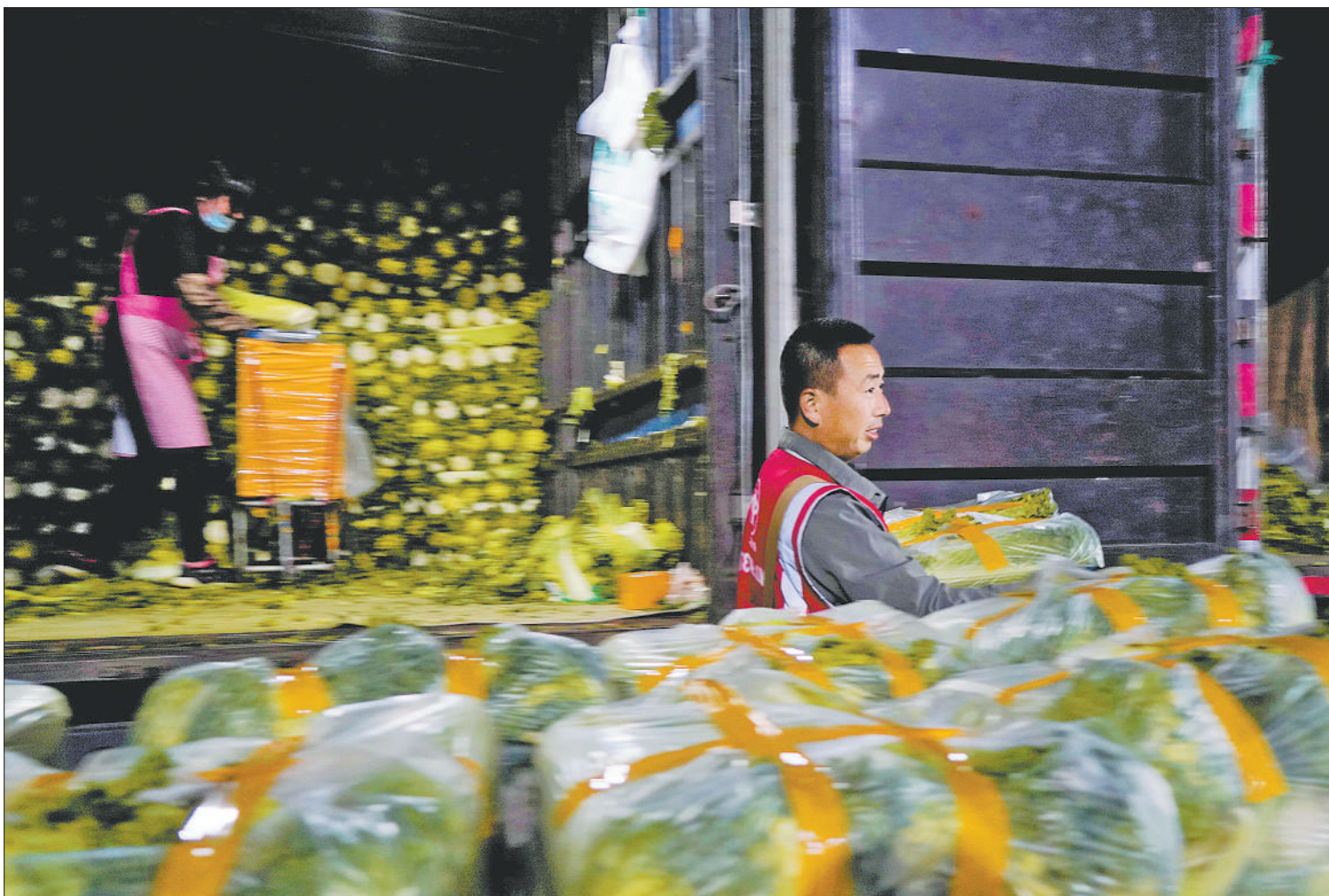
▲10月5日晚，北京新发地农产品批发市场蔬菜交易区，商户在搬运蔬菜供应市场。假日期间，新发地市场供应量稳定，蔬菜水果品种不断上新，为节日市场提供了有力保障。