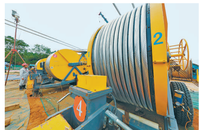
雅中至江西±800千伏特高压直流输电工程是保障西部水电消纳、满足中东部地区绿色发展需求的“西电东送”重大项目。目前，该项目江西段塔基挖掘工作基本完成。图为工作人员进行导线展放。