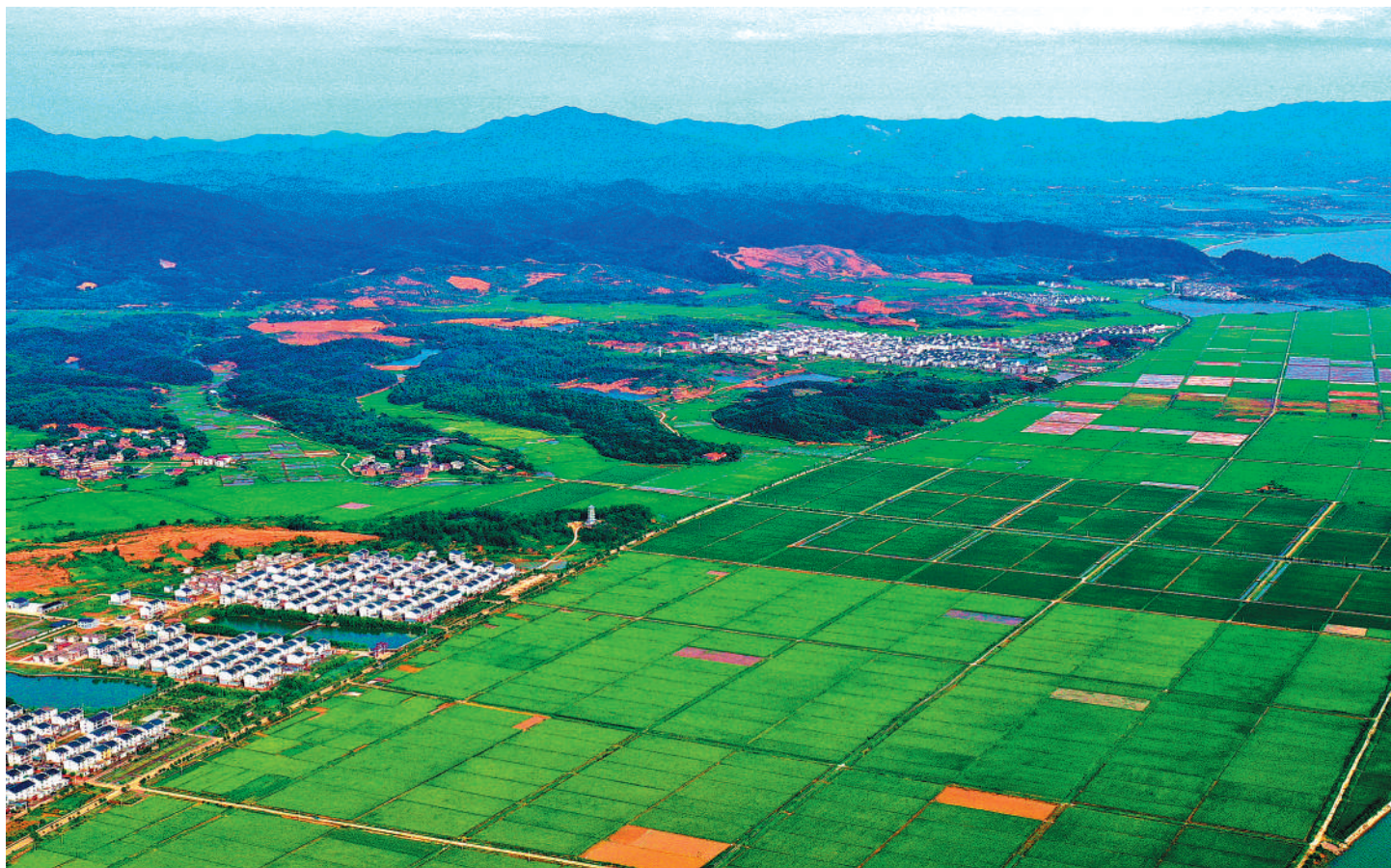
近年来,江西省吉水县孔巷移民新村探索出一条现代农业、乡村旅游等融合发展的绿色乡村振兴之路。

在9月24日的国新办发布会上,农业农村部副部长韩俊介绍了中办、国办近日印发的《关于调整完善土地出让收入使用范围优先支持乡村振兴的意见》。《意见》提出,到“十四五”末,土地出让收益用于农业农村比例达到50%以上。韩俊表示,最近几年,全国每年土地出让收入六七万亿元,土地出让收入用于农业农村比例每提高一个百分点,就相当于每年增加了600亿元至700亿元“三农”投入。