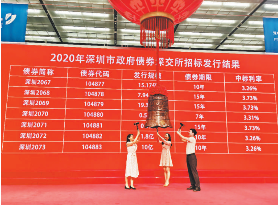
8月27日,2020年深圳市政府一般债券(三期)14亿元和专项债券(57期至77期)165亿元成功发行。截至目前,深圳今年共发行政府债券合计482亿元。图为2020年深圳市政府债券招标发行现场。