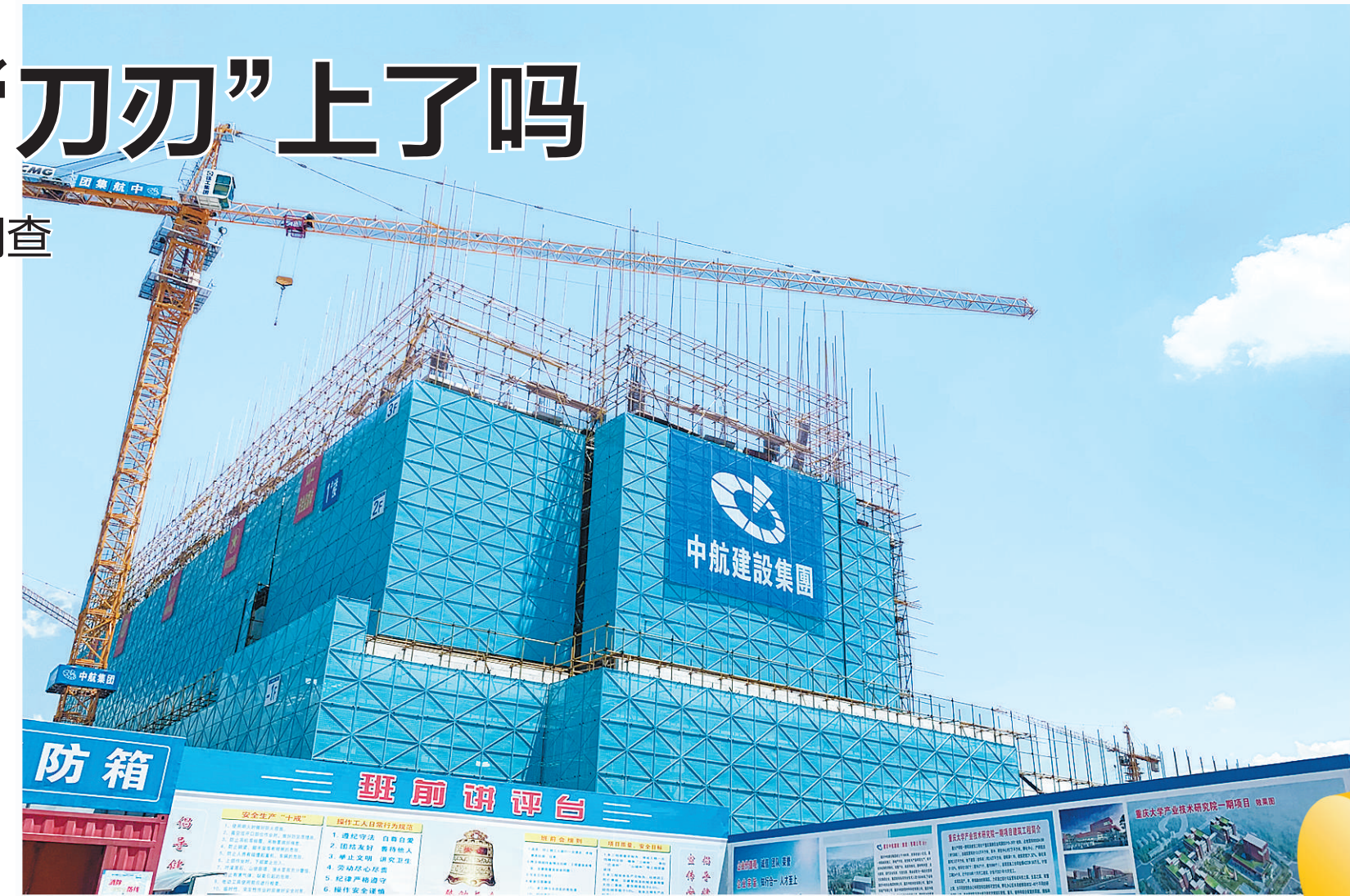
图为重庆大学产业技术研究院一期项目工程现场。

资金用在“刀刃”上,让一些地方交通更便利。深圳机场卫星厅工程项目总投资105.7亿元,2019年已发行专项债18.5亿元,今年续发31.5亿元。卫星厅设计规模为23.5万平方米,按照年旅客吞吐量2200万人次建设,建成后将大力提升深圳机场的基