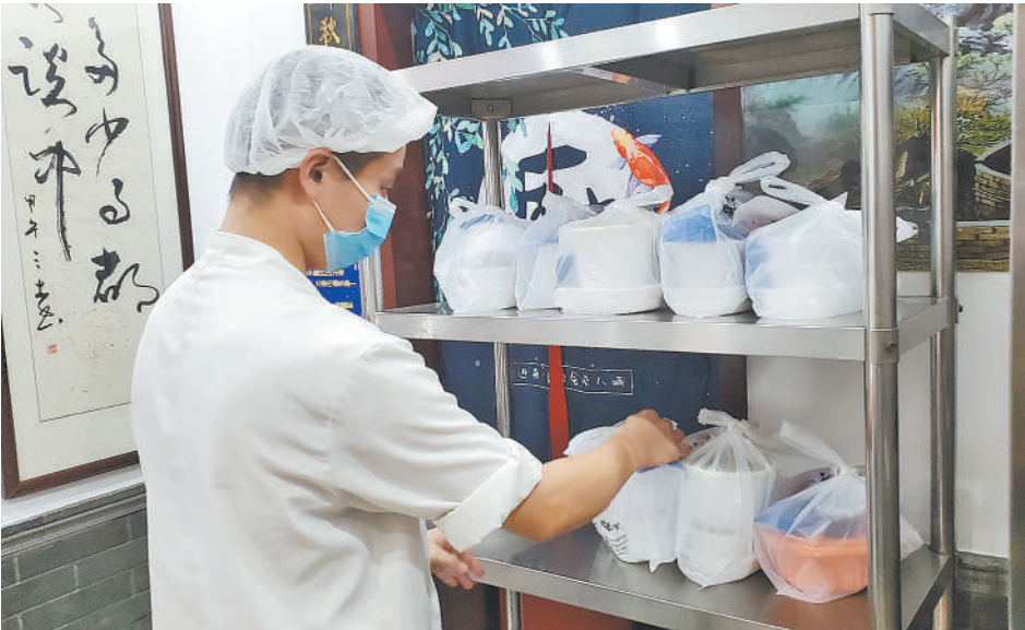
9月7日上午11点，真地道京味府闹市口店的外卖订单已接30多单。图为餐厅工作人员正在整理打包好的外卖。