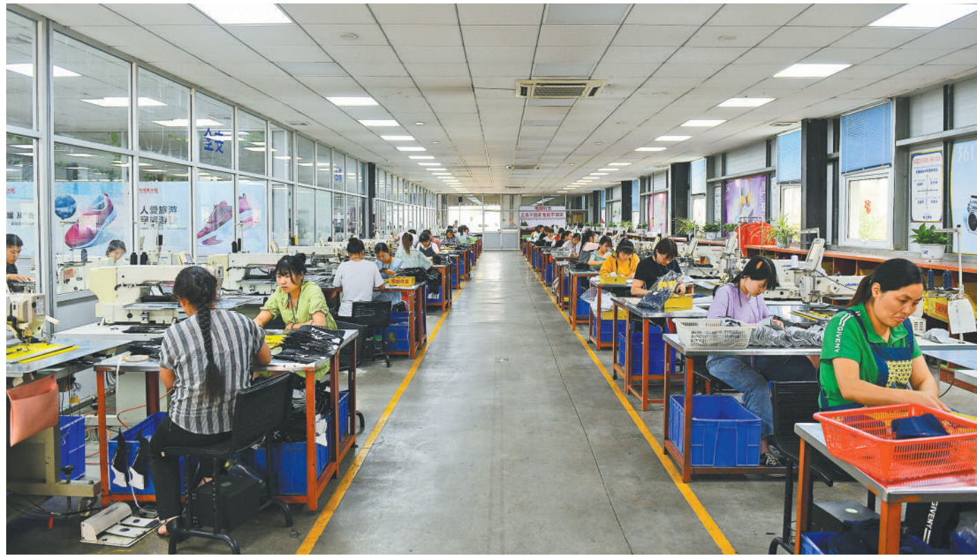
睢县足力健鞋业有限公司智能化针车车间。

东弘鞋业很快得到200万元普惠金融贷款，压力骤减。据统计，今年上半年，睢县除为企业展贷、续贷外，还设立还贷周转金1000万元，为企业融资1.2亿元，上半年睢县共为中小微企业减免各种税费5000多万元，帮助企业招工7000多人，有效缓解了企业经营压力。为企业提供金融支持，3月份以来睢县先后出台15条措施支持中小企业发展。