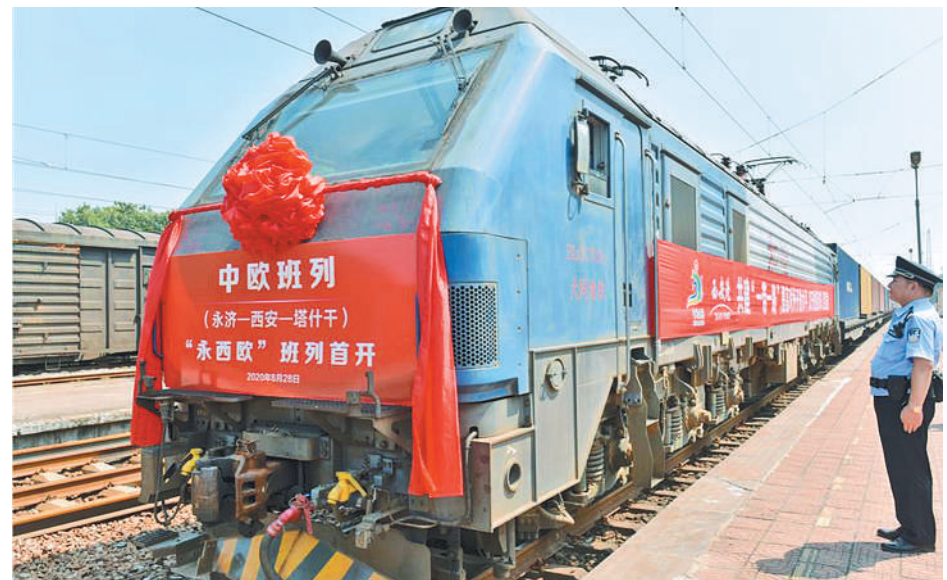
近日,陕西西安携手山西永济开通了“永西欧”中欧班列。