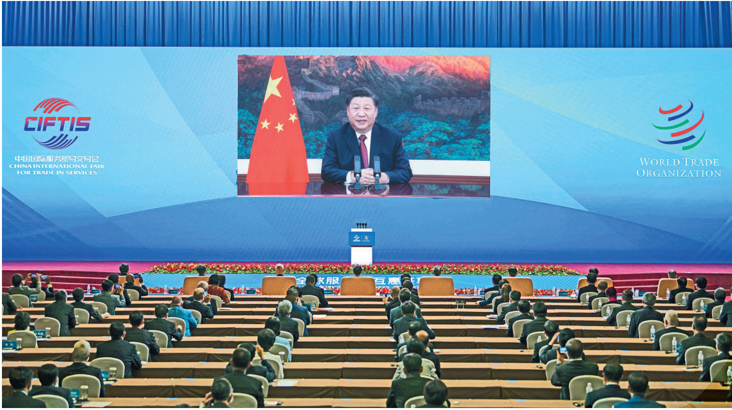
9月4日,国家主席习近平在2020年中国国际服务贸易交易会全球服务贸易峰会上致辞。