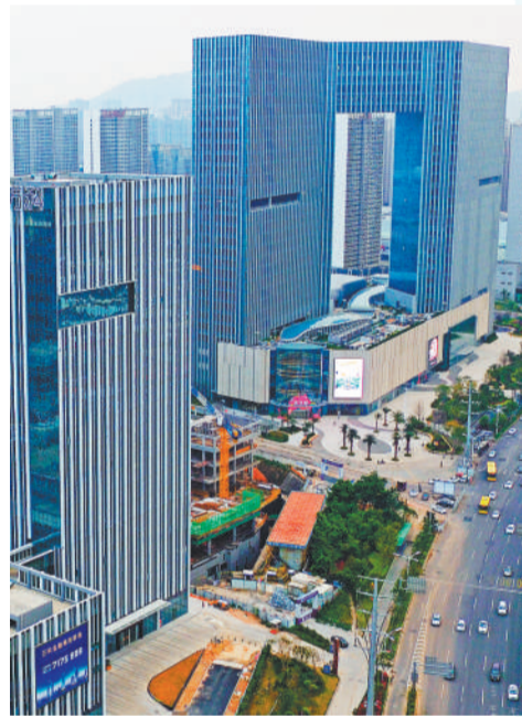
位于厦门湖里区的两岸金融中心。

如今，湖里区整合建设、市政园林、执法、环保等各部门信息化管理平台，将市容环卫、城管执法、园林绿化、市政养护、数字化监督全部纳入“大城管”格局，探索建立“一条热线”接入、信息“一个平台”提供、诉求“一个渠