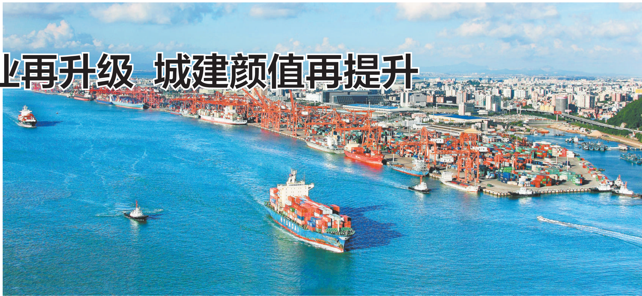
繁忙的厦门湖里东渡港区。