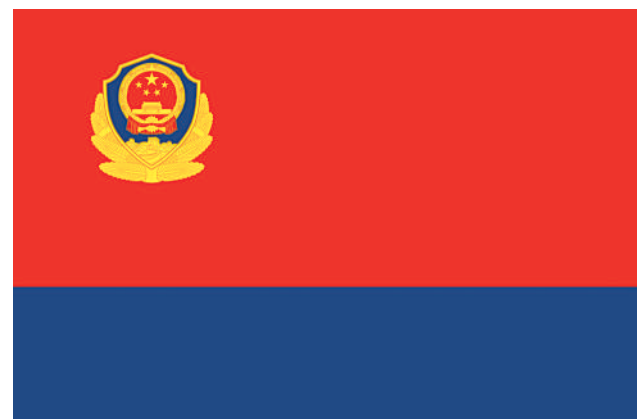
中国人民警察警旗式样。

警旗是人民警察队伍的重要标志,是人民警察荣誉、责任和使命的象征。确定中国人民警察警旗,对于深入推进人民警察队伍革命化正规化专业化职业化建设、激励人民警察忠实履行党和人民赋予的新时代使命任务具有重要意义。