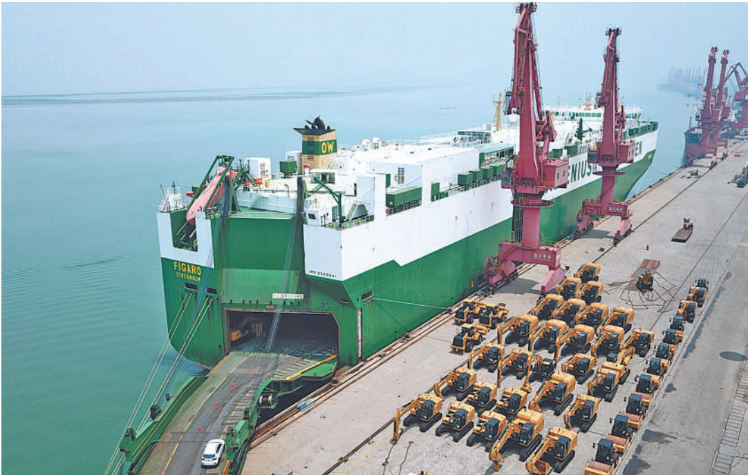
6月19日,江苏连云港港,一艘滚装船正在装载一批出口海外的货物。在减税降费等多项政策支持下,我国外贸企业抓住机遇复工复产,加快“走出去”步伐。

今年以来,面对严峻复杂的形势,党中央及时部署出台了一系列减税降费政策,放水养鱼,助力市场主体纾困发展。各级财政、税务等有关部门落实落细相关政策措施,把该减的税减到位,该降的费用降到位。今年1月份至6月份,新增减税降费15045亿元,有效减轻了市场主体负担。