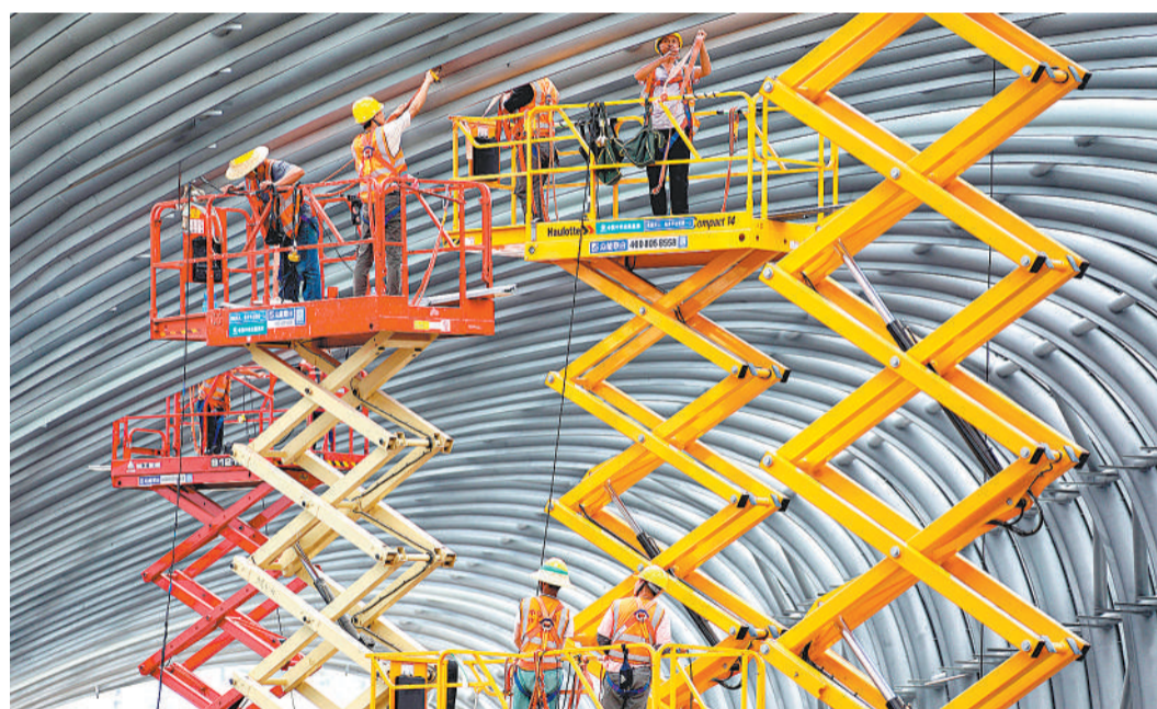
日前,由中铁四局钢结构建筑公司承建的深圳月亮湾立交主线跨线桥隔音屏工程主体结构顺利合拢,标志着项目工程建设进入新阶段。

为加强线上空间展示,开展网络招商合作,文化服务专题展依托服贸会数字平台,精心搭建了富有北京特色和时代特点的“云上文博展”数字平台。该平台将通过在线场景服务和视频互动及大数据分析,完成对参展商的精准需求对接,实现“云上文博展”所需的在线论坛、圆桌会议、视频直播、项目推介、商务洽谈、数字签约等商务服务,达到线上项目洽谈精准推介的目标。