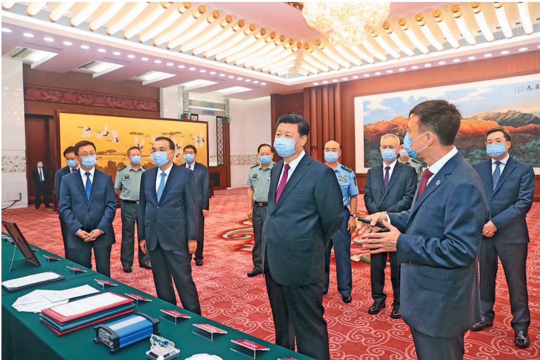
7月31日上午,北斗三号全球卫星导航系统建成暨开通仪式在北京举行。中共中央总书记、国家主席、中央军委主席习近平出席仪式,宣布北斗三号全球卫星导航系统正式开通并参观北斗系统建设发展成果展览展示。