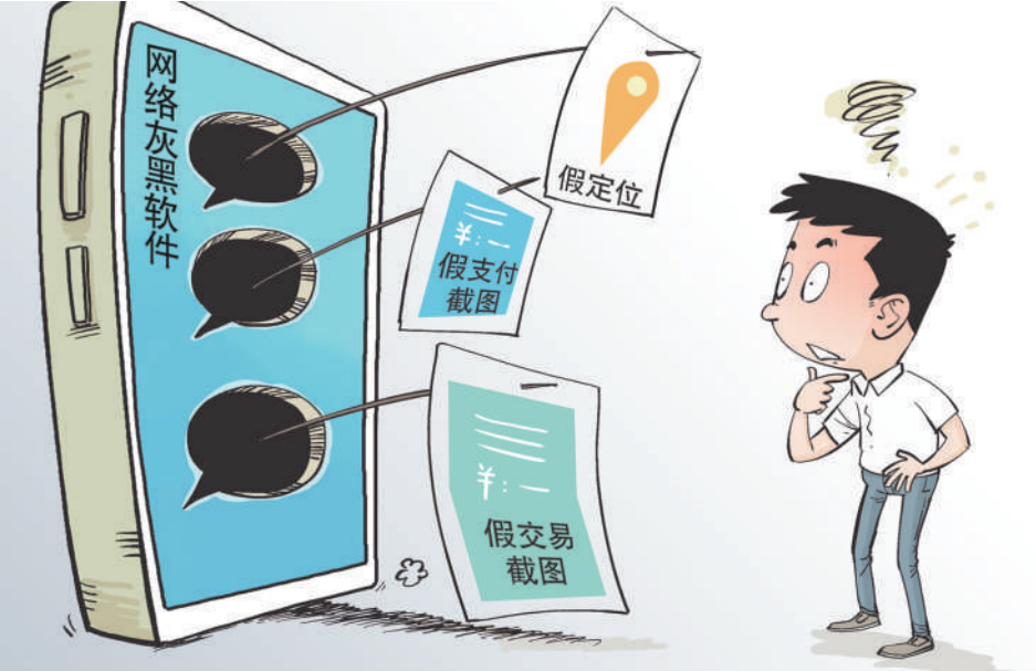
警惕网络灰黑软件诈骗。

未来，房地产市场调控仍会坚持“房住不炒”定位，负有调控主体责任的地方政府也会精准施策、一城一策，既避免市场过热，又防止大起大落，促进房地产市场平稳健康发展。同时，摆脱对房地产市场依赖，要找准切入点，持续推动城市开发方式转型。大力发展新兴产业，培育新动能，不断推进我国经济向高质量发展迈进。