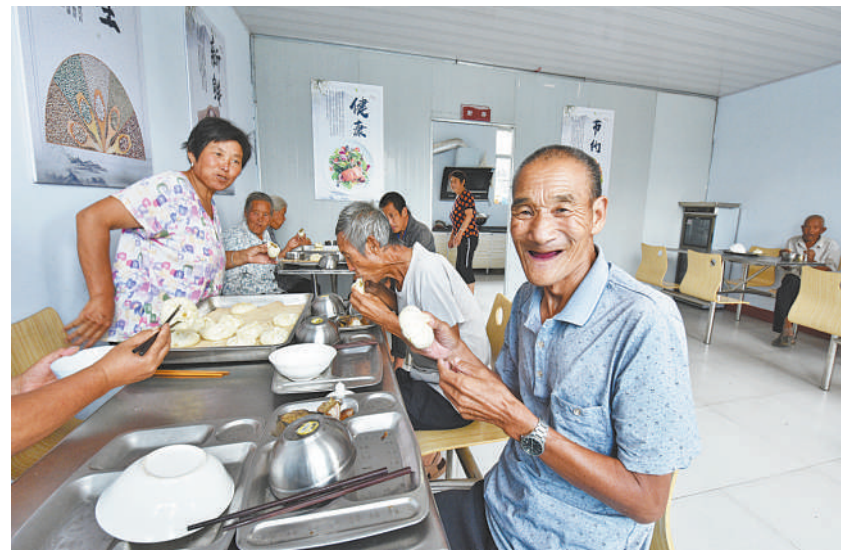
在山东五莲县梁家崖前村互助养老幸福院,老人们正在用餐。