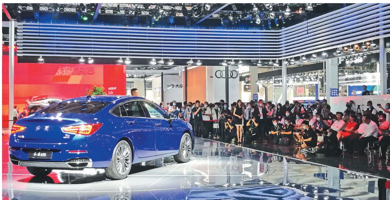
7月10日,一汽红旗在第十七届中国(长春)国际汽车博览会上宣布全新H5正式上市。

同期举办的第二届红旗嘉年华共设计了15场主题活动。红旗品牌携手中国一汽旗下自主品牌、合资合作品牌,以家族包馆的方式,在9号馆向外界展示新产品、新技术及新理念。