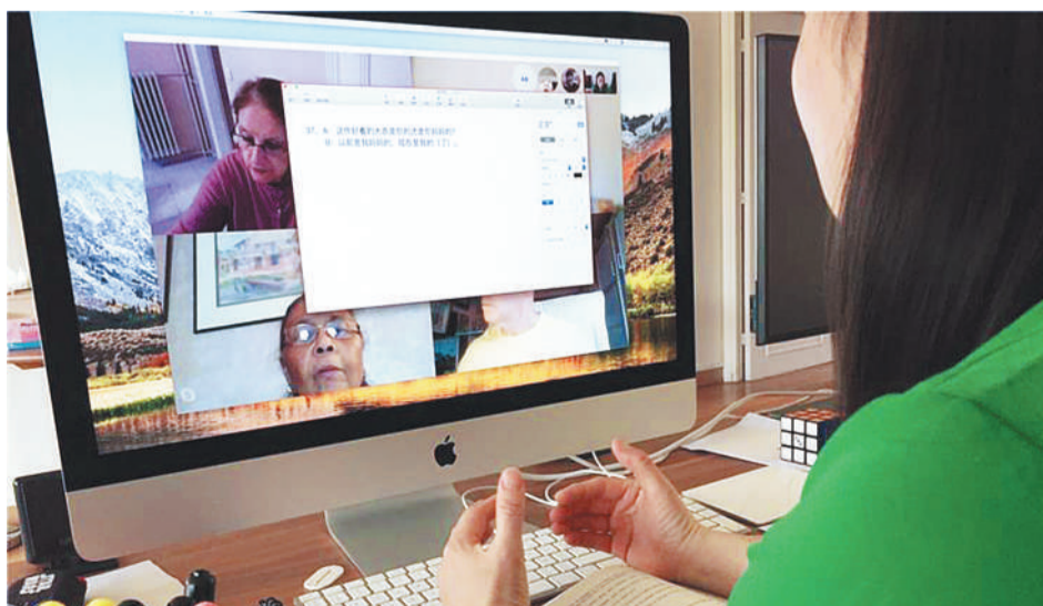
巴黎中国文化中心的老师正在为学员线上授课。

2020年巴黎中国文化中心共招收951名学员,创历史新高。面对年初突如其来疫情,中心积极开展远程教学试验,确保所有教学培训课程在2月中旬移至线上,实现线上、线下教学及活动无缝衔接,做到“居家上课不停摆、文旅活动不打烊”,受到学员们的好评和点赞。中心的养生课导师、全欧洲中医药专家联合会主席朱勉生教授结合法国民众现状,融汇中国传统养生理念精髓,独创“培元八式”防疫养生操,邀请法国民众在中心网站“云”养生,调动人体体内自我康复能力,达到祛病强身效果。同时,中心还与国家图书馆合作,成功推出数字图书馆平台,以互