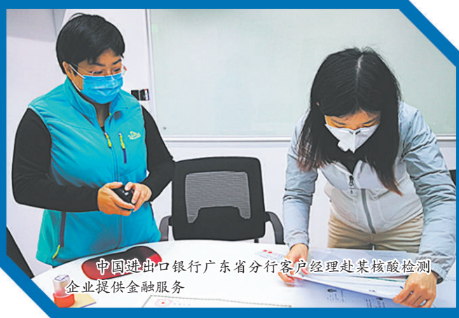
中国进出口银行广东省分行客户经理为客户提供金融服务