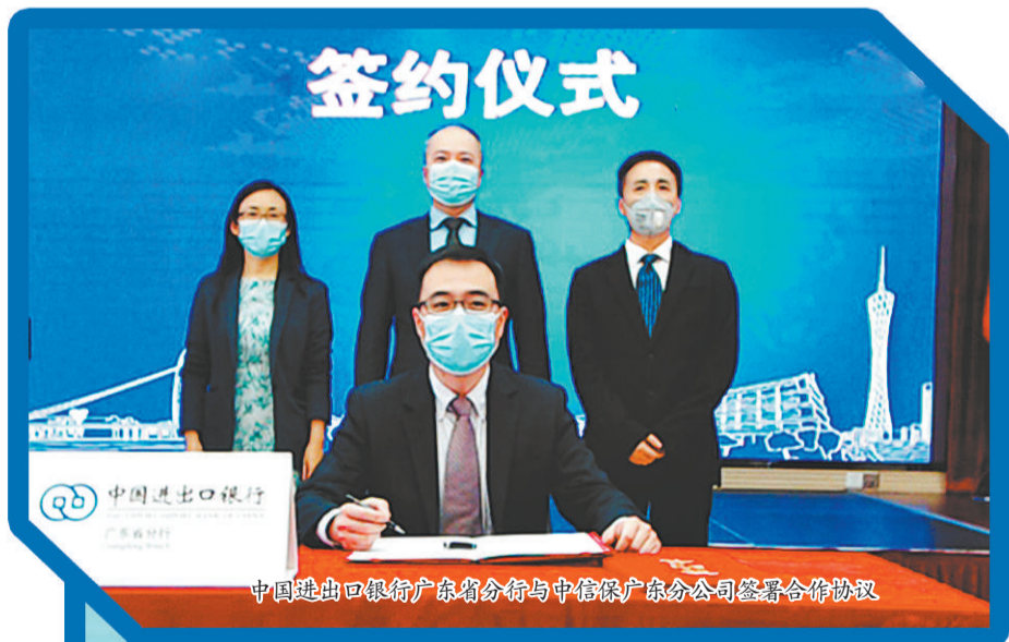
中国进出口银行广东省分行与中信保广东分公司签署合作协议

新冠肺炎疫情发生以来,中国进出口银行广东省分行统筹做好支持疫情防控和经济社会发展工作。持续加大信贷资金供给,全力保障辖区内企业资金需求,发放贷款和新增贷款均创本行同期历史新高。截至5月中旬,累计发放贷款352亿元,同比增长37%;新增贷款140亿元,同比增长18%;贷款余额突破1200亿元,达到1268亿元,提前完成“十三五”规划目标。