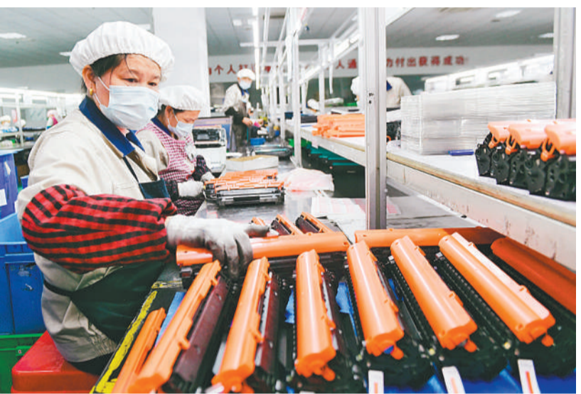
五月二十四日,在江西新余的亿铂电子公司,工人在生产线上忙碌。该企业生产的磁鼓全部出口,一季度实现出口创汇一亿四千四百多万美元。