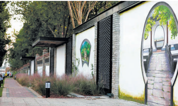
贯穿河南信阳平桥城区南北的主干道平中大街改造一新。

从过去插花式、零星单栋改造到如今集中成片的整体化改造、精细化管理；从优化路网结构到配套设施全面改善，城市功能逐步完善；从百姓安居到文化理念的注入……和谐、幸福、美丽新平桥正因城市更新改造，而实现内功外景的双提升。