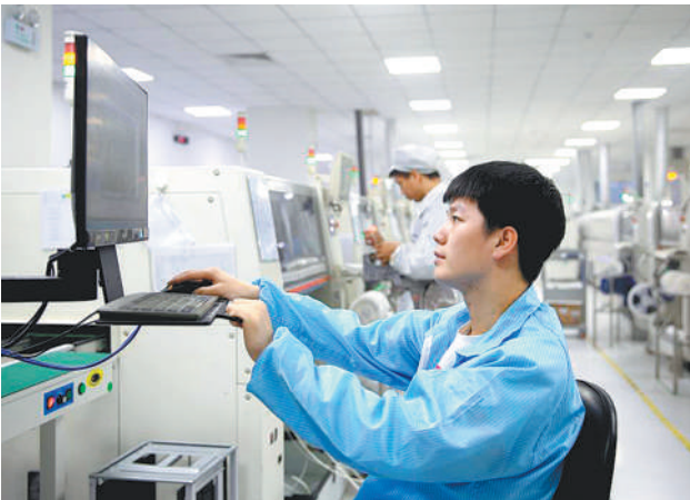
在廊坊市固安县工业园的一家企业内，员工对新型显示配件生产线进行调试。

5月18日至20日，以“新动能、新机遇”为主题的2020年中国·廊坊国际经济贸易洽谈会（网上）将在河北廊坊启幕。这一经洽会已成为河北省推介发展机遇、产业优势、投资环境和招商项目的重要平台。