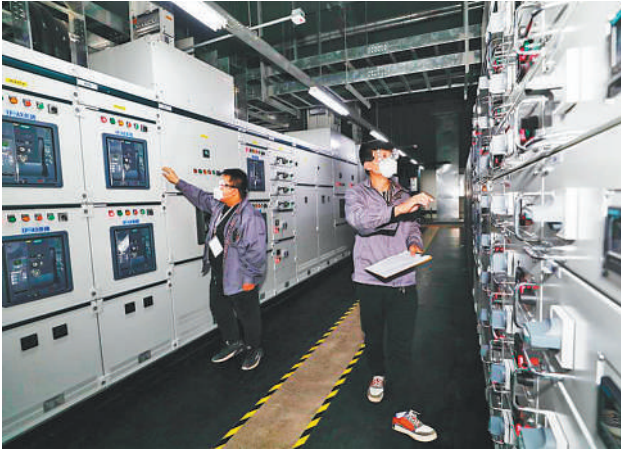
在位于廊坊市的润泽国际信息港数据机房内，工作人员检查设备运行情况。（资料图片）