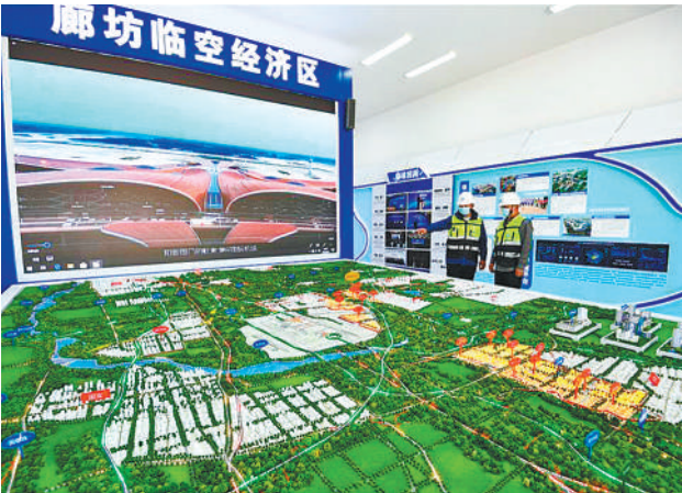
图为廊坊临空经济区前线指挥部规划展厅。