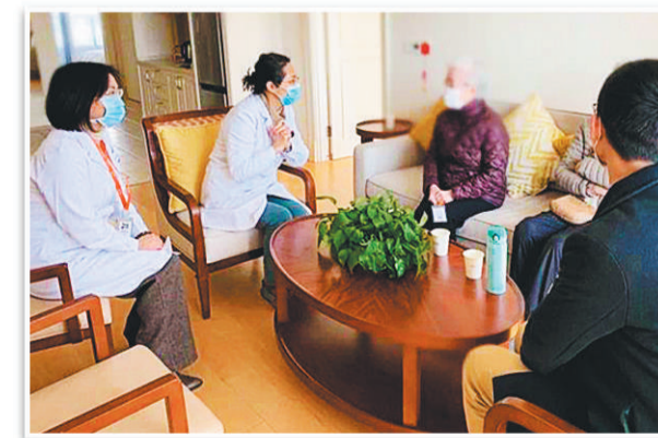
上海申园康复医院专家团队上门对养老社区居民进行心理关怀。(资料照片)

疫情之下，泰康之家充分发挥了养老社区自建康复医院的优势，极大缓解了居民就医和焦虑情绪，为老人筑起“急救—慢病管理—康复”的三重防线。据介绍，泰康之家全国社区已入住老人3000余人，这次疫情无一例感染。