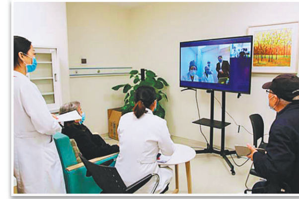
老人患者在泰康之家成都康复医院与北京专家进行远程会诊。(资料照片)