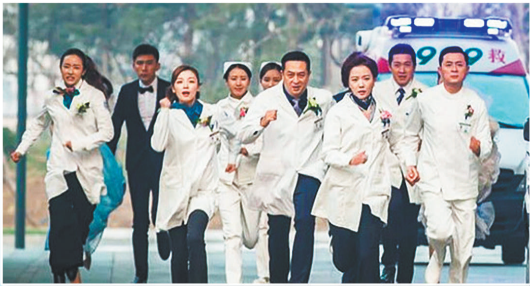
《急诊科医生》剧照。

疫情期间,国产电视剧的出色表现也坚定了影视从业者的信心。他们认为,面对突发疫情的挑战,电视剧充分发挥了鼓舞士气、凝心聚力的功能,再次印证了优秀文艺作品可以用温暖的故事为现实中的人们带来希望、勇气和力量。