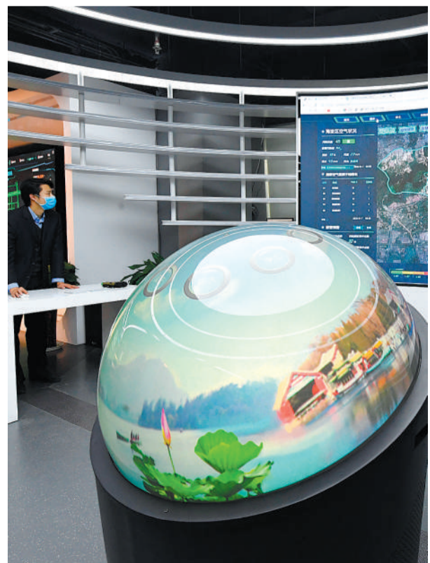
在海淀(中关村科学城)城市大脑展示体验中心，工作人员展示海淀区生态环境领域分平台。

近年来，为了提升治理水平，北京市海淀区整合区域内各政务系统，将信息资源集约整合，开发“城市大脑”综合系统，打造新型智慧城市。新华社记者 任超摄