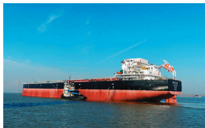
3月15日,安徽省芜湖造船厂新建成的6.4万吨散货船出厂试航。