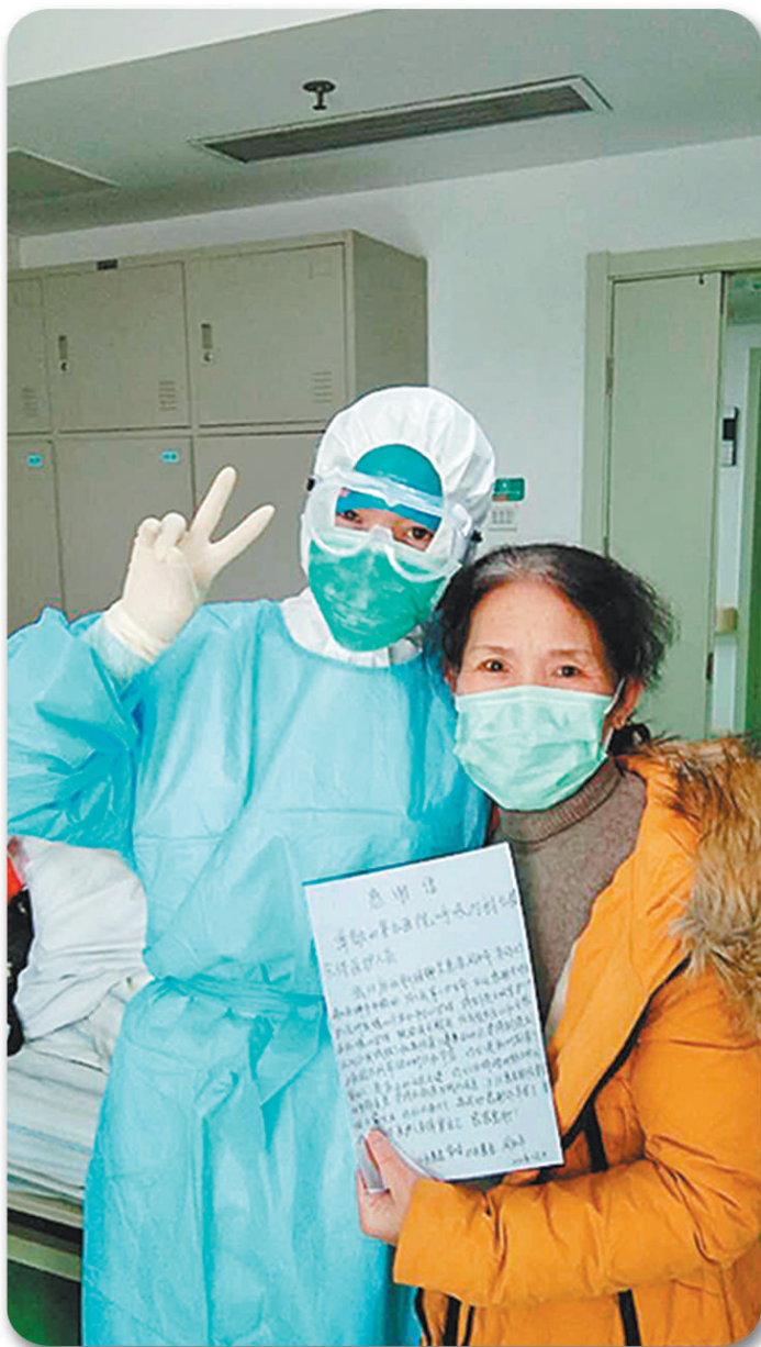
25床患者痊愈出院,留下一封感谢信。(资料图片)