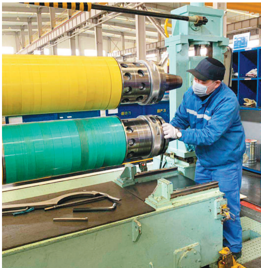
日前,在安徽省芜湖市、市政府的积极协调下,韩资企业浦项汽车配件制造有限公司芜湖分公司制造车间顺利复工复产。

此外,在中国经济转型升级的过程中,服务业面临着大发展的机会,为了提升服务业的竞争能力,促进快速发展,中国还应该应该在电力、民航、铁路、邮政以及市政公共行业等基础设施领域扩大外商投资的市场准入,进一步扩大对外开放的力度。金融、医疗、教育、养老等服务业也要进一步放宽外商投资的准入限制。“通过努力营造外商投资的优良环境,推动制度性开放,来稳定外商投资的预期。”桑百川表示。