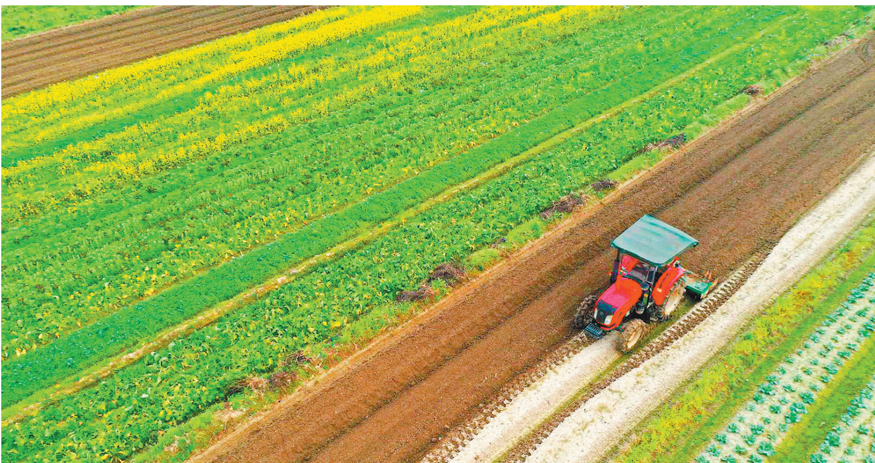
2月26日，湖南省道县营江街道芒寨村，农机手驾驶拖拉机在耕地忙春耕。春田满花盛开，道县乡间田野色彩斑斓，忙碌期间的农民与田野构成了一幅美丽的春耕图。