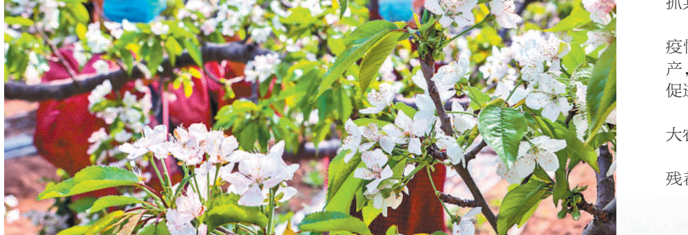
河北省邯郸市农民抢抓农时，加快恢复农业生产，开展春耕春管工作。图为邯郸市鸡泽县利济镇桃种植基地的工作人员在给温室樱桃人工授粉。（新华社发）

春耕时节，农资保障是关键。把农资储备作为重点工作，农业、供销、交通等相关部门密切配合，拓展调运渠道，加大连锁业务配送，构建农资服务网络，全力保障化肥、农药、农膜、种子等春耕农资需求。