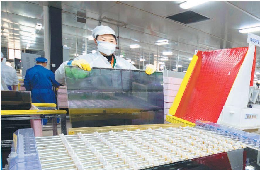
2月19日,江西新余高新区光电产业园沃格光电公司员工在TFT-LCD生产车间进行清洗、打磨流程作业。江西全面建立“两手抓、两促进”帮扶工作机制,帮助企业复工复产。

2月11日,在宜春经开区武藏野化学(中国)有限公司,复工后生产的首批50吨乳酸甲酯产品装车发出,从上