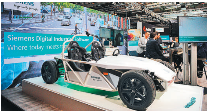
为期两天的2020年度“互联世界”物联网大会19日在德国首都柏林拉开帷幕。图为物联网大会国际展商展台。