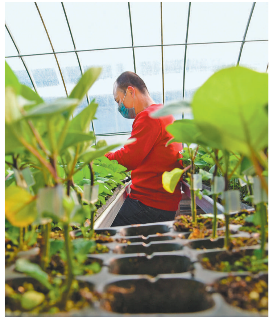
2月7日,农民正在河北省邯郸市曲周县育苗产业园内劳作。

“当前的物价上涨更多是供给扰动,并非需求拉动。中国经济面临的主要矛盾仍是需求不足问题,因此物价不会成为宏观政策的制约因素。”唐建伟表示,考虑到农产品生产的周期性特征,为避免供给波动造成价格大起大落,也为避免持续出现“谷贱伤农”情况,政府需要提早采取措施来引导市场供需平衡,相关企业和生产商也要在尊重市场规律的基础上合理安排生产,确保农产品生产供应平稳。