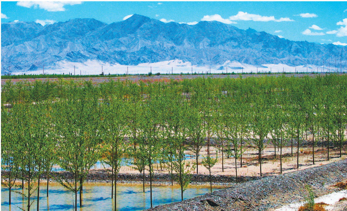
青海格尔木市不断加大植树造林力度,经过多年艰难推进,在戈壁沙滩形成了一道道阻挡风沙的生态屏障。